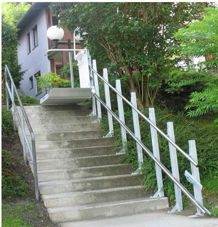
фотографија изгледа сличне платформе