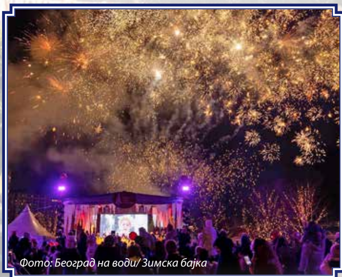
Фото: Београд на води/ Зимска бајка

Савски парк био је претворен у место из чаробних празничних бајки, уз шаренолик програм за све узрасте и укусе. Парк је био подељен у девет зона, те је свако могао да за себе изабере најзанимљивији садржај, међу којима су се истакли „Јелка најлепших жеља“ и „Магични лавиринт“. За најмлађе суграђане викендом су на главној бини извођене представе дечјих позоришта, а омиљена глумачка лица читала су најлепше дечје бајке. Улаз је био бесплатан.