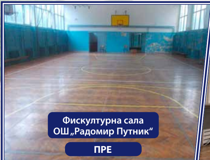
Фискултурна сала ОШ „Радомир Путник“