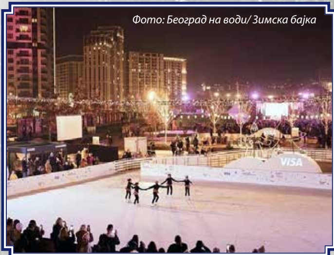
Фото: Београд на води/ Зимска бајка

У Савском парку, у простору Београда на води, од 15. децембра 2022. до 15. јануара 2023. трајао је фестивал „Зимска бајка“. Посетиоци овог модерног дела општине Савски венац имали су прилику да током месец дана уживају у музичком и културном садржају, богатој гастрономској понуди и другим незаобилазним зимским активностима, којима се најмлађи највише радују, попут клизања и дружења са Деда Мразом.