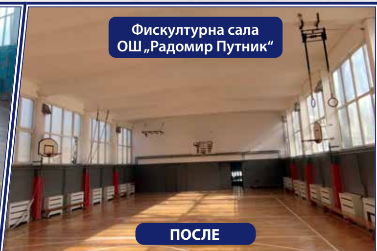
Фискултурна сала ОШ „Радомир Путник“