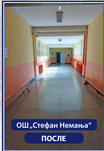
ОШ „Стефан Немања“