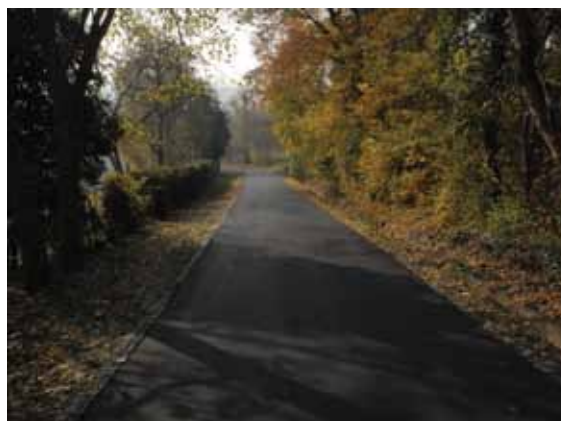
Једноставно и логично решење за смањење гужве: нова пречица ка петљи код Цареве ћуприје