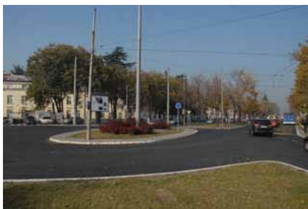
Дедињски сквер после дуго времена под новим слојем асфалта: бржи пролаз за многе возаче