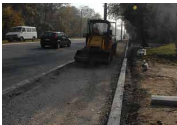
Формирање пешачке стазе у Булевару Кнеза А. Карађорђевића: захтев грађана