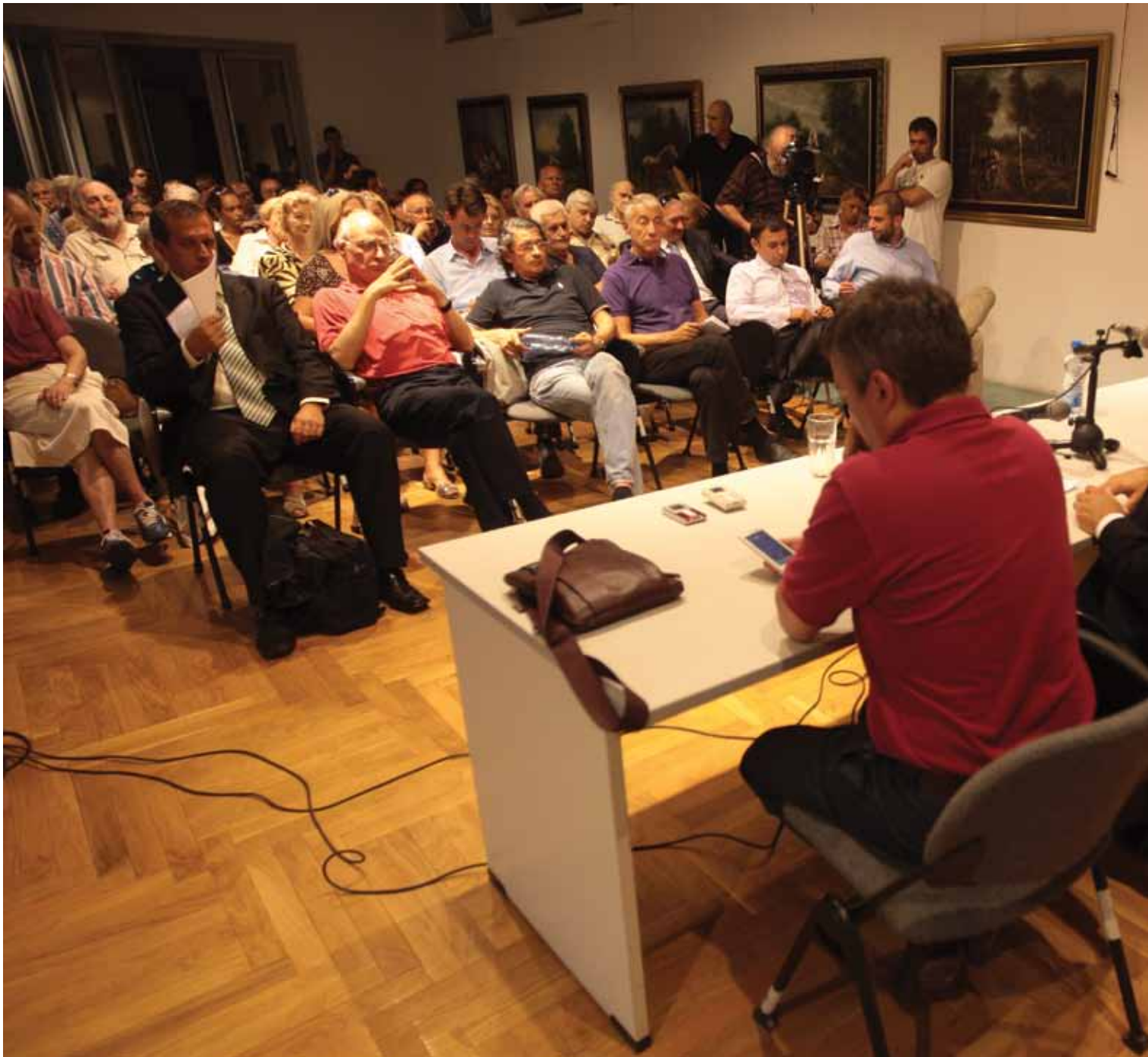
Потпредседник Владе Републике Србије у разговору са житељима Савског венца