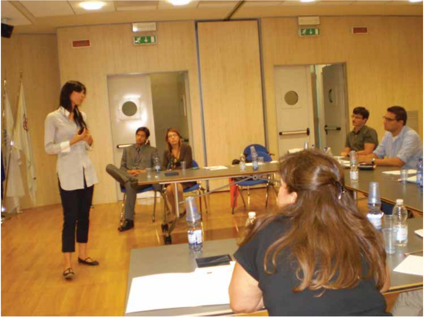
Пројекат ЕНЕРГИС у студијској посети Падови