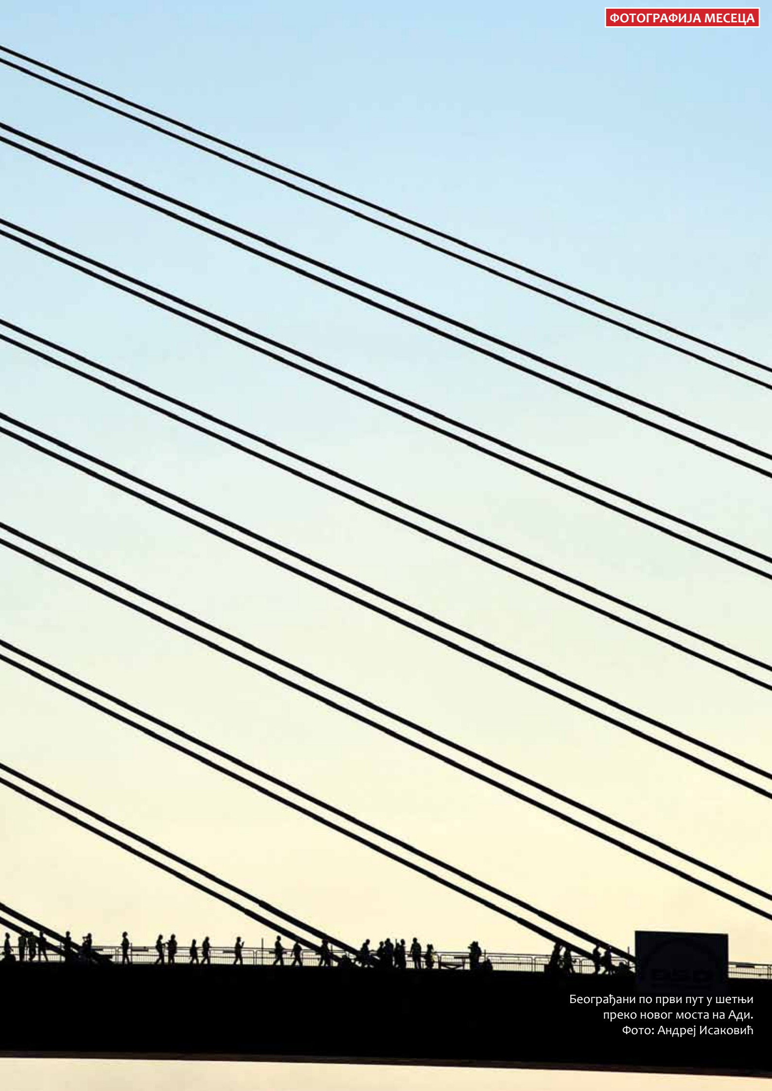
Београђани по први пут у шетњи преко новог моста на Ади.