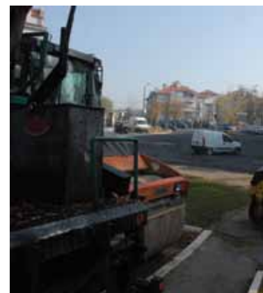
Машине ЈКП „Београд Пут“ на уласку у Драјзерову улицу