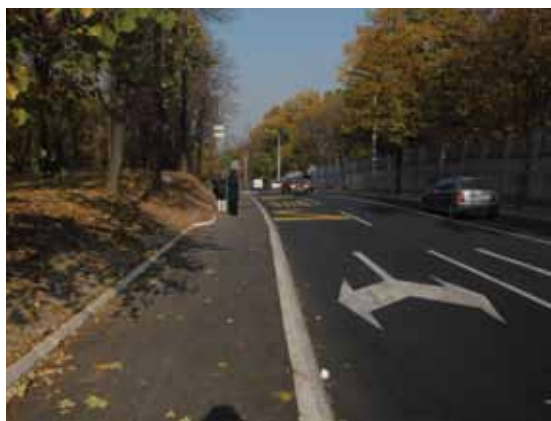
Проширење у Љутице Богдана: аутобуси ГСБ више не успоравају саобраћај када уђу у станицу