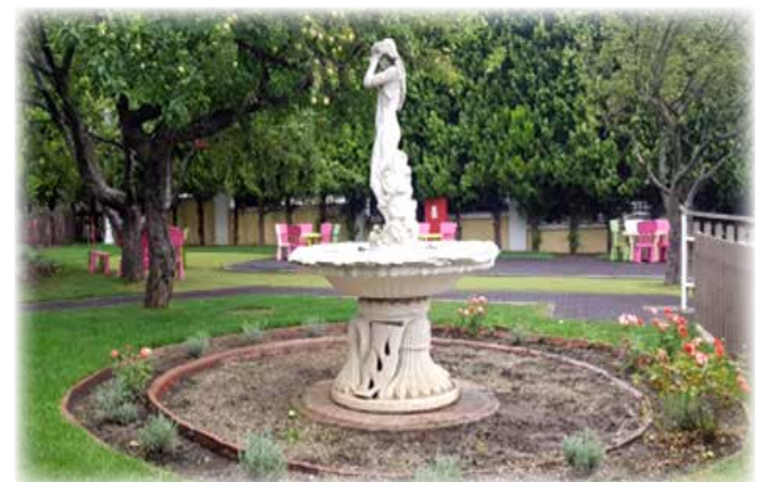
ОШ „Креативно перо“ – најлепше школско двориште

Акција „Најзелено“ представља једну од континуираних активности од значаја за заштиту животне средине на подручју општине Савски венац. Кроз предлоге најлепших зелених површина на територији Градске општине Савски венац, ова акција сваке године даје значајан допринос и акцији ЈКП Зеленило - Београд „За зеленији Београд“.