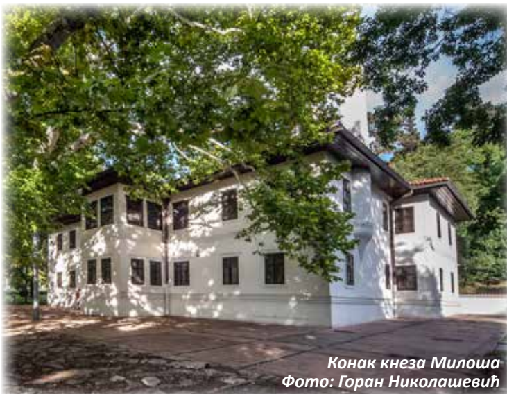
Конак кнеза Милоша

И у годинама које су следиле и поред бројних садржаја који су ту ницали (ковница новца, казнени завод, расадници са првом стакленом баштом и школом за баштоване, кафане, касније и летња позорница), Топчидер је задржао ексклузивност градске зелене оазе и једног од првих и најлепших београдских паркова.