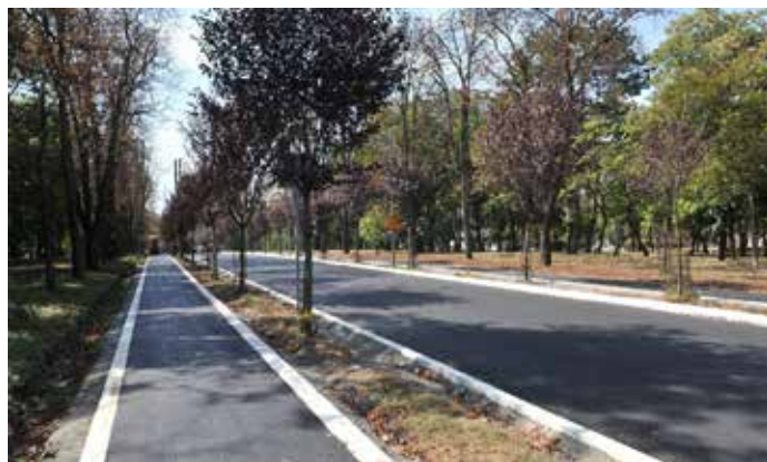
Булевар војводе Путника

Заменик градоначелника је најавио реконструкцију Савског трга, као и уређивање неколико урбаних џепова на територији Савског венца и реконструкцију Улице Краљевића Марка, за коју се, како је навео, ради пројекат.