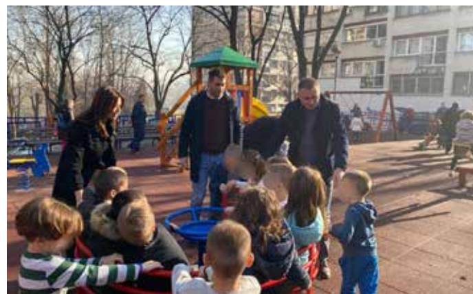
Улица Љутице Богдана

Малишани Савског венца су ове године добили и још једно ново игралиште, у Улици Љутице Богдана, које је изграђено на иницијативу грађана, а за које су обезбеђена средства у оквиру наградне игре „Узми рачун и победи“.