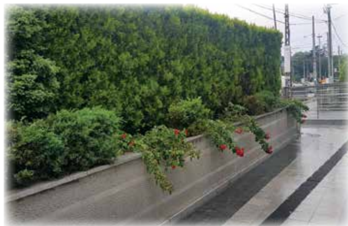
„Енергогруп“ – прво место у категорији Најлепша зелена површина испред пословног објекта