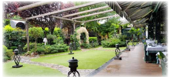
Ресторан „Франш“ – најлепше уређено зеленило угоститељског објекта

ОШ „Креативно перо“ победила је у избору за најлепше школско двориште, а за најлепше зеленило око предшколске установе вртић „Harry kids“.