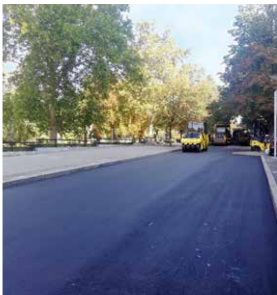
Улица Светозара Марковића

Грађани Савског венца заједно са руководством општине активно учествују у унапређењу животних услова и стварању бољег и лепшег места за живот. На иницијативу грађана, ЈКП „Београд пут“ у септембру је завршило радове на реконструкцији асфалта у Улици Светозара Марковића, на делу од Улице краља Милана до Бирчанинове. Такође, на иницијативу грађана општине Савски венац током јесени је обновљен асфалт и у Улици Косте Рацина.