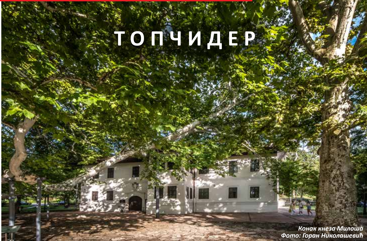
Конак кнеза Милоша

Смештен у уској речној долини, између Топчидерског брда и Кошутњака, Топчидер је од центра града најудаљенији део Савског венца. За историју Београда и наше општине Топчидер је веома важан, јер наспрот Београдској тврђави и Савамали у њеном подножју, од којих је удаљен око пет-шест километара, представља други крај осе око које се, стицајем околности, ширио град. Још почетком 19. века Топчидер је био густа, претежно храстова и букова шума, коју су Карађорђе и његови устаници користили као склониште из којег су у Првом српском устанку јуришали на Београд. Отуда и потиче турски назив Топчи-дере , што значи тобџијска долина (или поток), а односи се на Топчидерску реку која том долином протиче.