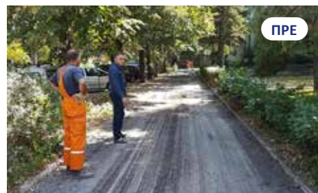
Улица Косте Рацина

Грађани Савског венца заједно са руководством општине активно учествују у унапређењу животних услова и стварању бољег и лепшег места за живот. На иницијативу грађана, ЈКП „Београд пут“ у септембру је завршило радове на реконструкцији асфалта у Улици Светозара Марковића, на делу од Улице краља Милана до Бирчанинове. Такође, на иницијативу грађана општине Савски венац током јесени је обновљен асфалт и у Улици Косте Рацина.